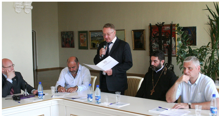
Приветствие от председателя Комитета по межнациональным отношениям и реализации миграционной политики в Санкт-Петербурге Олега Ивановича Махно зачитал его первый заместитель Вадим Яковлевич Окрушко